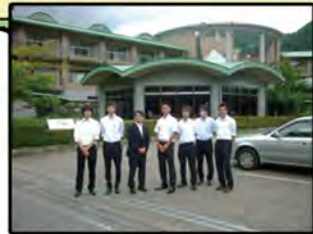
現地視察の様子(昨年夏、インターン生と共に)

高齢者・障がい者・母子家庭の福利厚生を目的とした保養施設(※誰でも利用可)だったが、民間譲渡の見通しが立ったため、あじさい館を廃止する条例を定めた。