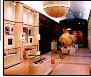
【平和資料館の常設展示】

この他、補正予算では「道路標識点検調査(※県道の小型標識の劣化状況調査等)」や「河川施設等調査事業(※護岸の形状や橋の構造調査)」などが計上されており、和光市でも実施される予定です。