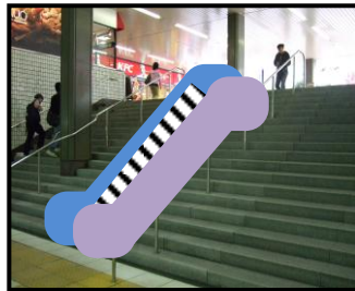
(あくまでイメージ図です)

来年度(～平成23年度まで)の新規事業を記した“実施計画”の中に「平成21年度 エスカレーター設置整備事業」と明記されました。