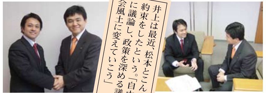
松本武洋 和光市長(右)と

10年、20年先を見据えて元気な和光をつくれるように、和光市と県の架け橋になります。和光の課題をどんどん県にぶつけていきます！