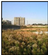
〈写真〉現在の外環 道路上部の様子

3、外環上部利用施設計画は「白紙」になりました！ 葬祭場・宿泊施設・バスターミナル等の複合施設案が示されましたが、特に宿泊施設について、 年間利用が見込めない などの理由から、計画を白紙に戻すことになりました。 市は今後「もっと市民の声を聞いていく」としています。