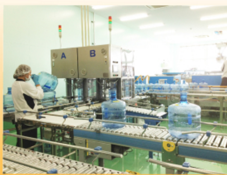
県企業局整備の 妻沼西部工業団地内に 設置されている アクアララ(株) 熊谷プラント