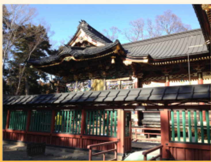
観光政策の一環として 昨年県内の建造物としては 初の国宝指定を受けた 熊谷の「歓喜院聖天堂」にも 立ち寄りました