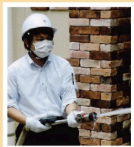
防災設備の視察。自ら体験することも重視しています