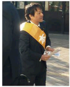
議会後には必ず 駅立ち

駅でまちで自分の足で配り続けて9年目、ついに 100万枚 を突破しました。読んでくださる皆さまと多くのボランティアの方に支えられています。今後もマンガも活用して「伝える県政報告」を続けます。