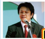
県の様々な情報をお伝えします

年2回、夏と冬に「井上わたるの茶話会」を開催して直に県政の最新情報をお伝えしています。市議時代から続けている茶話会は意見交換=広聴の場としても議会活動に活かしています。また行事挨拶の機会をいただく際には、積極的に県政の話題をお伝えするよう心掛けています。