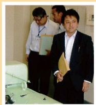
視察の成果は一般質問や委員会質問に活かします

県議会の委員会や会派視察のみならず、自主的な視察も積極的に行いました。また市民の皆様から陳情を受けた箇所にもすぐ向かい、必ず自分の目で現状把握するようにしています。その他、例えばがん政策や子宮頸がんワクチン、食物アレルギーなど専門的な学習会にも多数参加し、議会活動に活かしています。