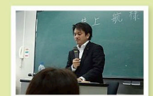
大学で選挙・行政に関する講演を担当