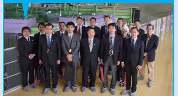
理化学研究所にて