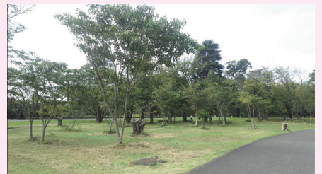
樹林公園の樹木再生に着手