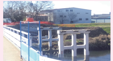
新河岸川の堤防工事と芝宮橋架換え

※道路・河川事業の実施に当たり、上記の「県費」の他、国からも4年間でおよそ「22億1,340万円」の予算を確保しております。 ※この他、信号や横断歩道補修に関する「警察費」や、市と県が連携して行うコバトン健康マイレージ事業を代表とする「福祉費」、特別支援学校改修費などの「教育費」も多く配分されています。