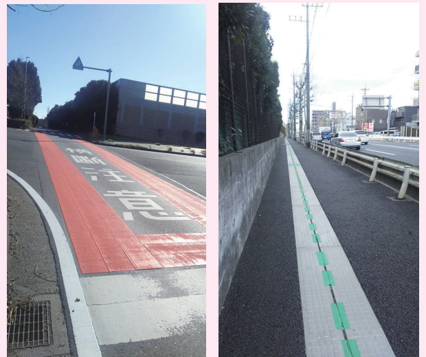
県道や県管理国道(254号線)の維持管理

県議の1期4年は限られた時間ですが、和光市での暮らしの改善に繋がるよう行動・実績を積み重ねてまいりました。 また市民の方から「和光市に県の予算は届いているの?」というお声もいただきます。その質問に、私は自信をもって「届いています。」とお応え出来ます。次の一覧表は、この4年間における和光市における主だった県事業(※土木・公園管理・地域振興をピックアップ)の予算配分です。 これからも和光市の発展に尽力します。