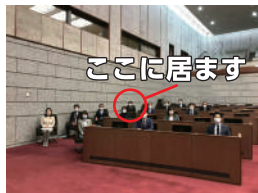
本会議場に仮座席を設けてソーシャルディスタンスを確保

井上 税務大学校・裁判所研修所での合同宿泊研修の中止要請に動く。知事・市長とも連携。⇒中止が決定する。