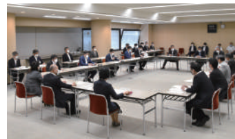
議会運営委員会も広い会議室に移動して開催しました