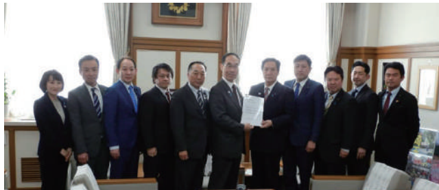
知事への要望提出

会派 2月4日「新型コロナウイルスによる肺炎への対策を求める緊急要請」を知事に提出。