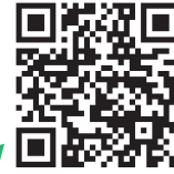
井上わたるの和光ブログ

新型コロナウイルス感染症の拡大に伴い、ネットを中心に活動報告を行なってまいりましたが、あらためて『配るホームページ』の配布を再開します。是非ご覧ください。