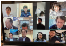
リモート会議の様子