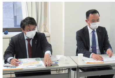
▲大阪観光局での視察の様子

私は11月に今年度所属する企画財政委員会で「公益財団法人 大阪観光局」を視察しました。埼玉県では産業労働部の「観光課」が観光行政を担っていますが、大阪では府・市それぞれが出資をして「観光局」を設立しました。行政では出来ない自由な発想、マーケティングやブランディングに取り組み、成果をあげています。埼玉県にも秩父・長瀨、川越などの観光地や、さいたまスーパーアリーナなどの大型施設も有りますが、県の観光への取組はインパクトに欠けているのが実状です。そこで、埼玉県が全国や世界からさらに注目されるためには、どのような戦略や都市づくりが必要と考えますか? 是非、大胆な発想・斬新なアイデアを聞かせてください。(大阪観光局の理事長からは「埼玉県に空港作ったらえんちゃう?」という話も出たくらいです。これくらい大胆なアイデアも大歓迎です。)