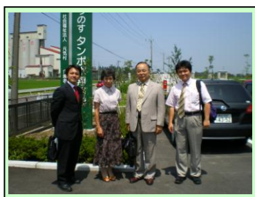
〔写真〕 高齢者施設 視察